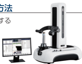
※各社ツールプリセットに対応