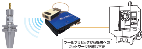
ツールプリセットから機械へのネットワーク配線は不要