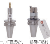
ツールに直接貼付 絵符に貼付

※2次元コードリーダで読取った後、2次元コードラベルは不要です。マガジンに工具を取付ける際に剥がしてください。