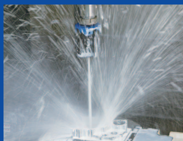
センタスルーで高圧洗浄