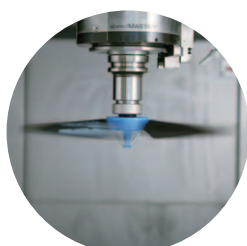
2,000min -1 以上

無人化運転を妨げる切りくず トラブルを一挙解決! 工程内での切りくず除去で 加工サイクルタイムの短縮改善